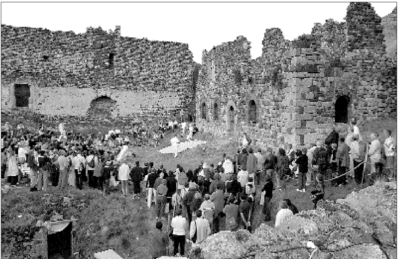
La représentation de l'atelier théâtre marquait le début d'une belle soirée avec un public conquis. (Crédit photo : Vincent Jolfre).