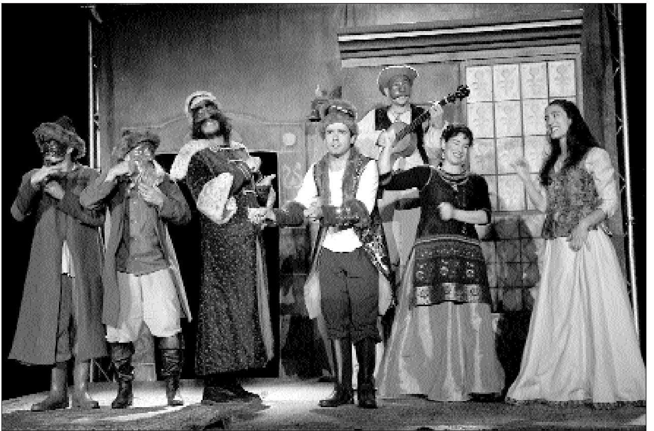
Une création vivifiante, tonifiante et enjouée : le Révizor.

La dernière représentation du Révizor est jouée lundi soir. Après quoi, le rideau des Théâtrales retombera sur le site majestueux du premier château de la Loire.